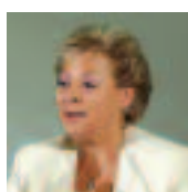
Nelly Olin ministre de l'Écologie et du Développement durable

J' ai souhaité poursuivre avec Yann Arthus-Bertrand le travail commencé il y a un an sur le développement durable. Son apport artistique me semble en effet essentiel pour donner à tous les professeurs des moyens pédagogiques à la hauteur de l'enjeu écologique auquel nous sommes tous confrontés. L'exposition pédagogique "La biodiversité : tout est vivant, tout est lié" contribue à développer des compétences inscrites dans le socle commun en permettant à tous les élèves de l'école élémentaire, du collège et du lycée d'acquérir un comportement responsable face à l'environnement. C'est en connaissant les enjeux de la biodiversité que les jeunes générations pourront agir et se donner les moyens de la protéger. Connaître pour agir, telle est la démarche de cette exposition qui nous propose d'envisager l'avenir autrement.