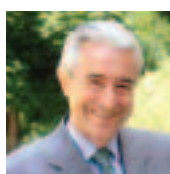
Gilles de Robien ministre de l'Éducation nationale, de l'Enseignement supérieur et de la Recherche